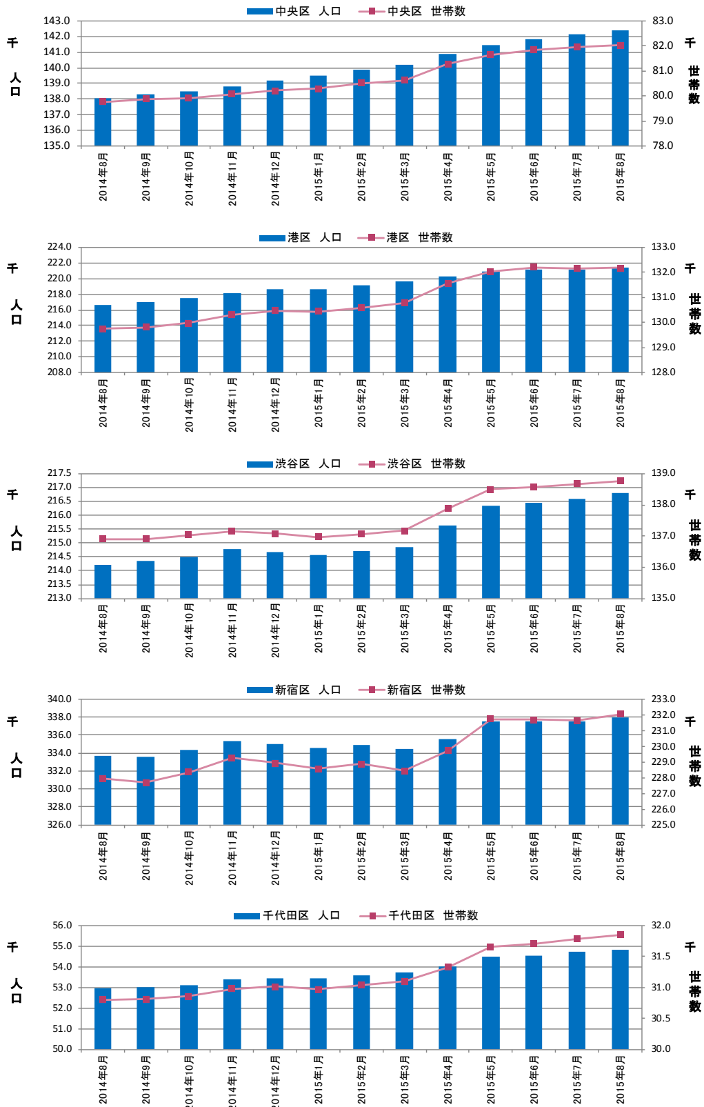
図表③ 都心5区 人口・世帯数推移