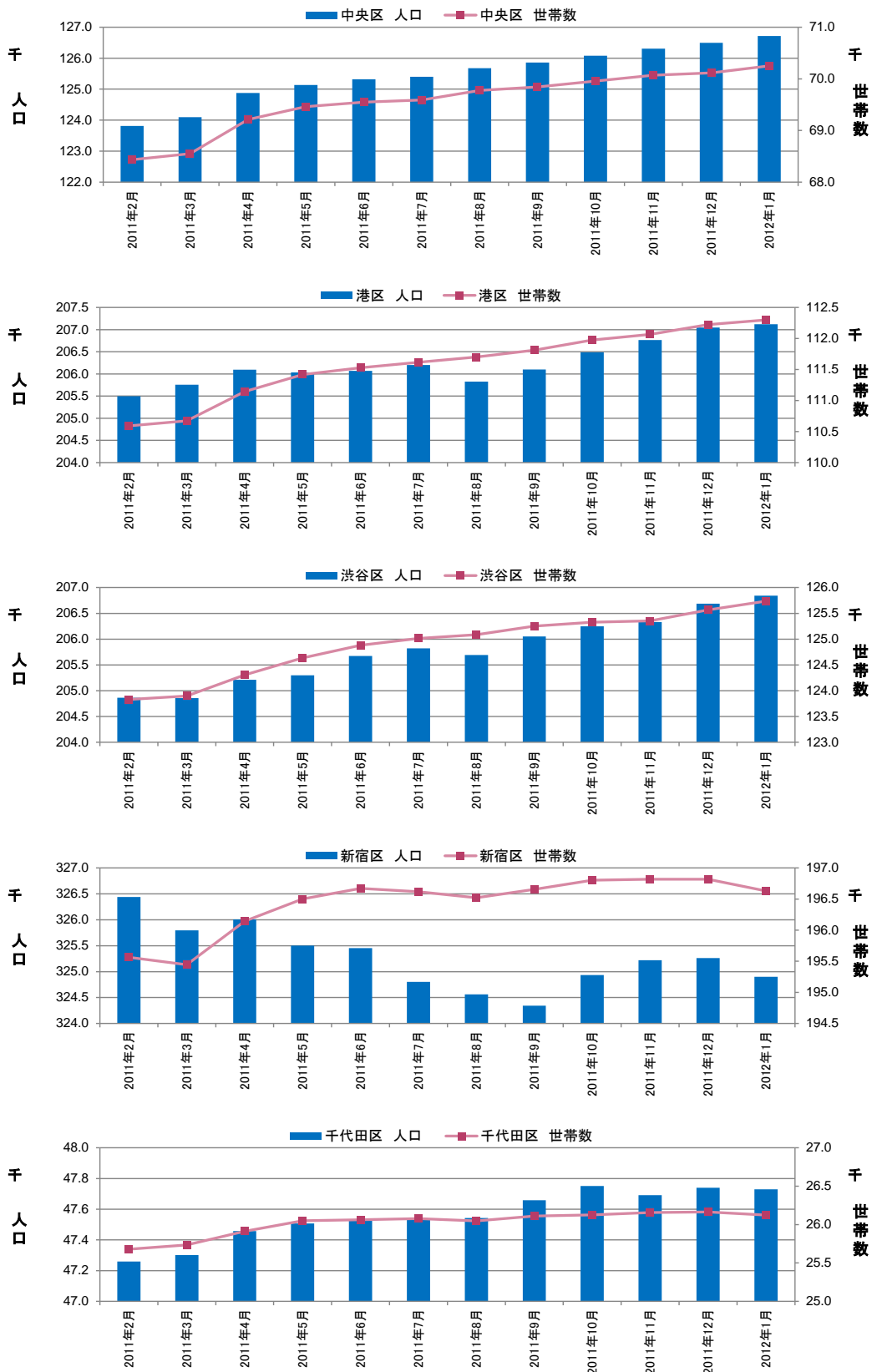
図表③ 都心5区 人口・世帯数推移