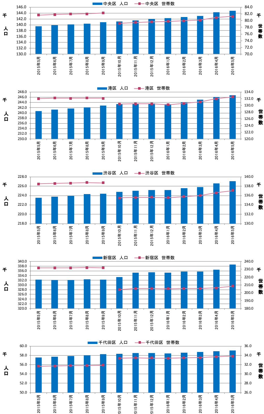
図表③ 都心5区 人口・世帯数推移