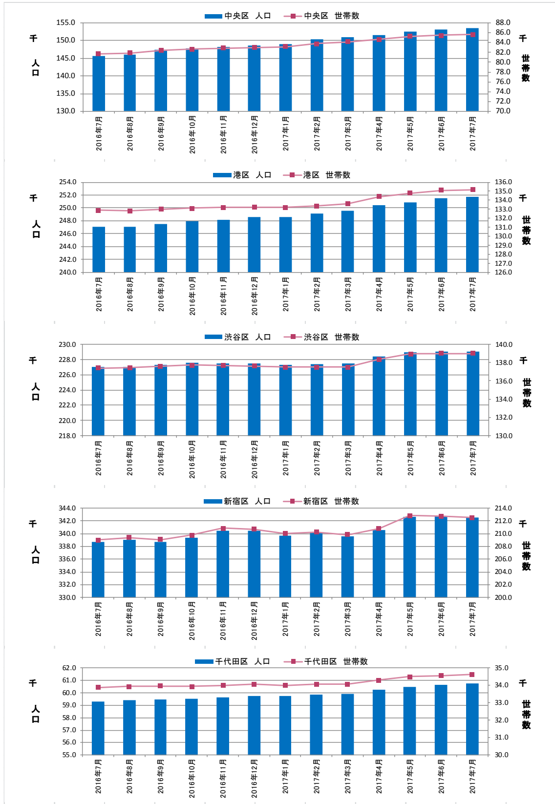
図表③ 都心5区 人口・世帯数推移