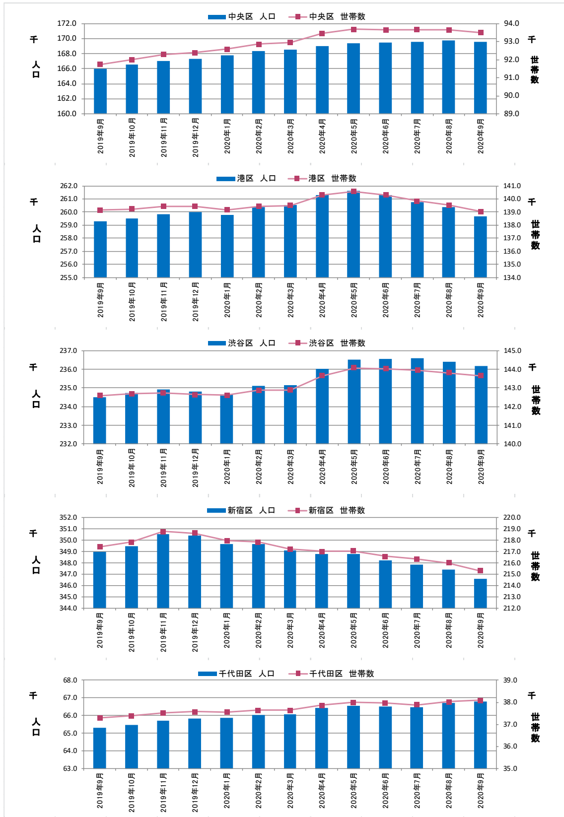
図表③ 都心5区 人口・世帯数推移