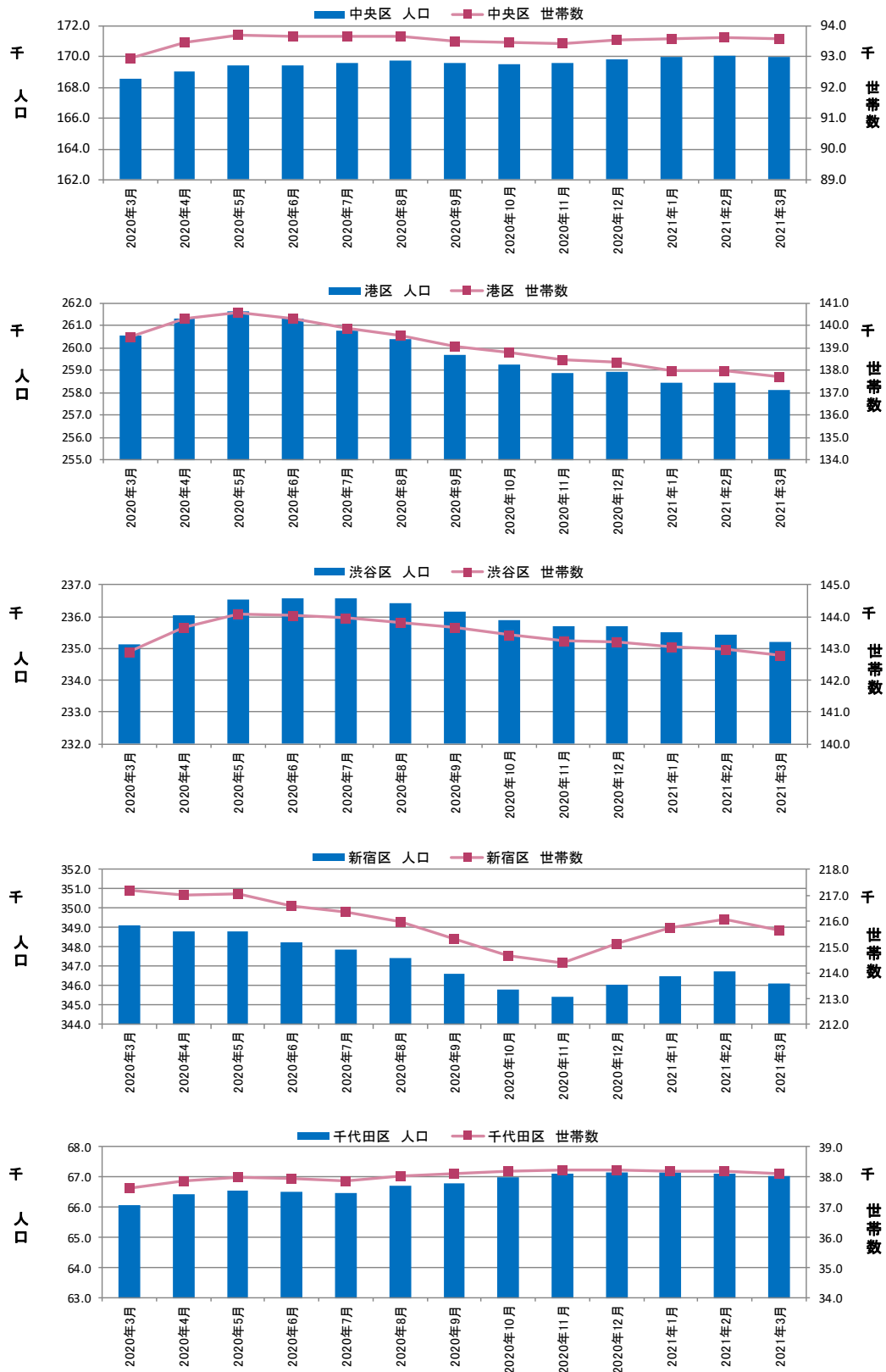
図表③ 都心5区 人口・世帯数推移