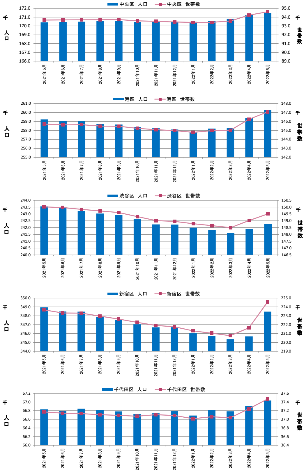
図表③ 都心5区 人口・世帯数推移