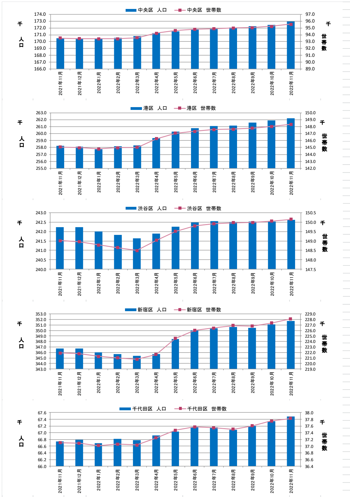
図表③ 都心5区 人口・世帯数推移