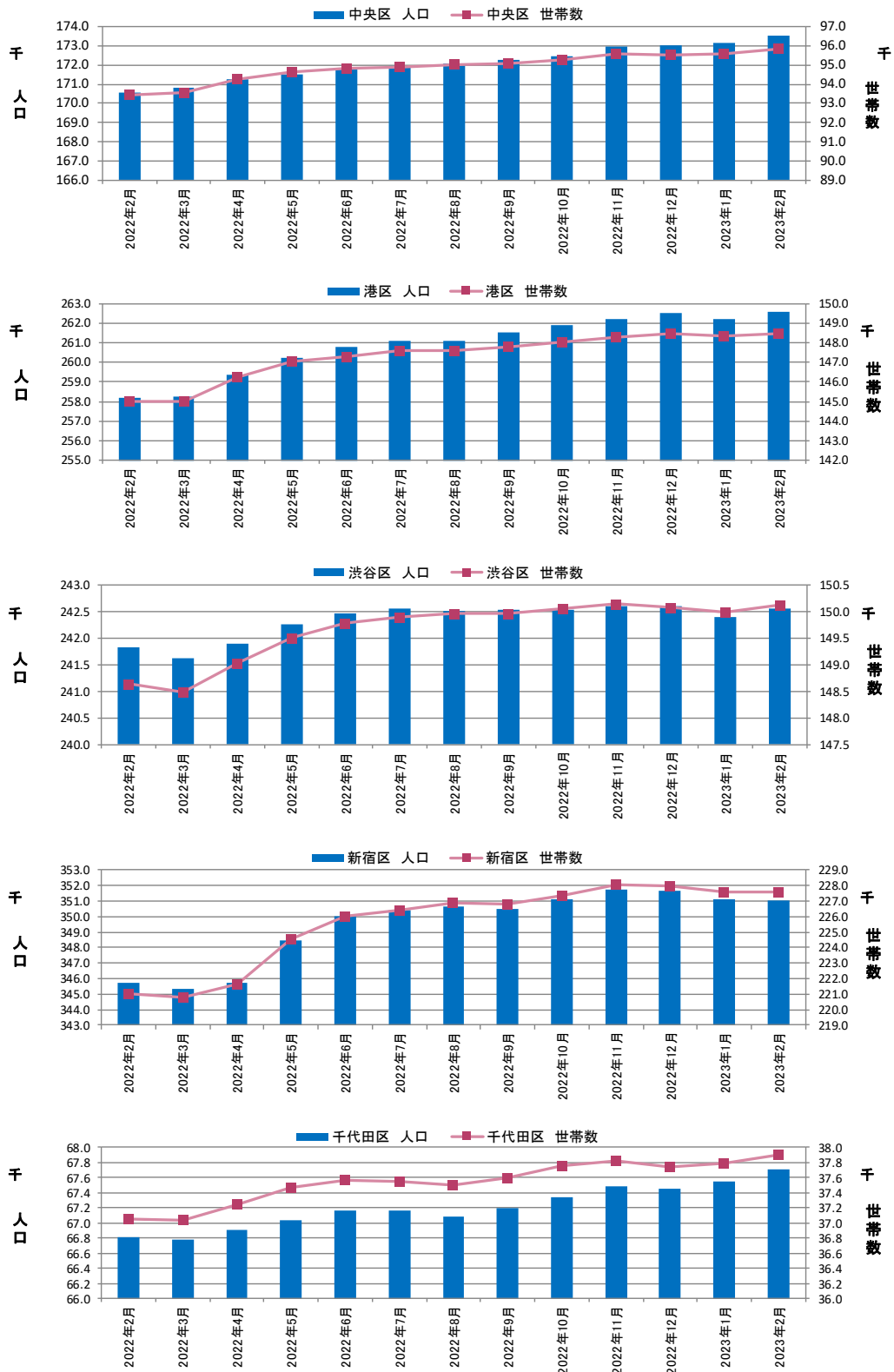
図表③ 都心5区 人口・世帯数推移