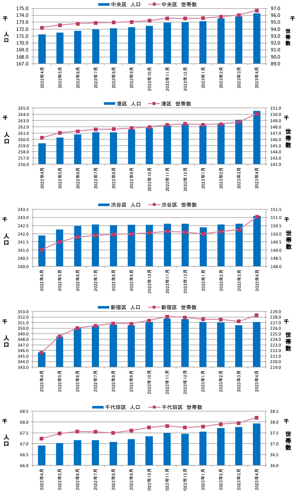
図表③ 都心5区 人口・世帯数推移