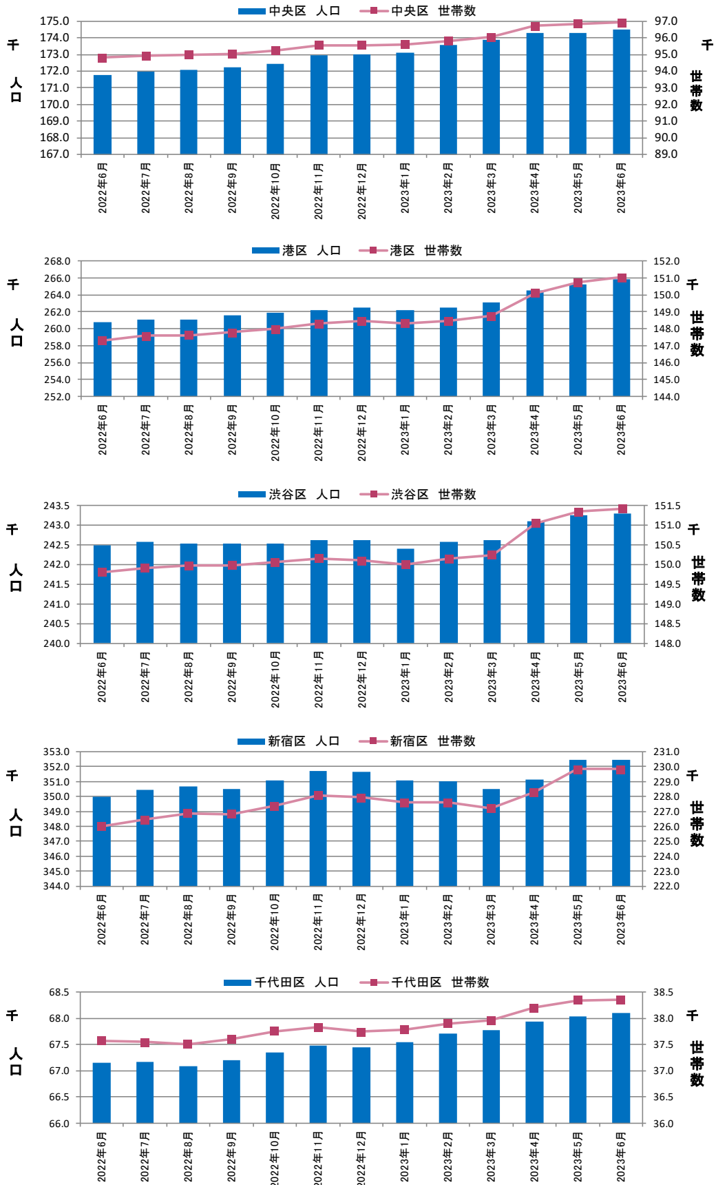
図表③ 都心5区 人口・世帯数推移