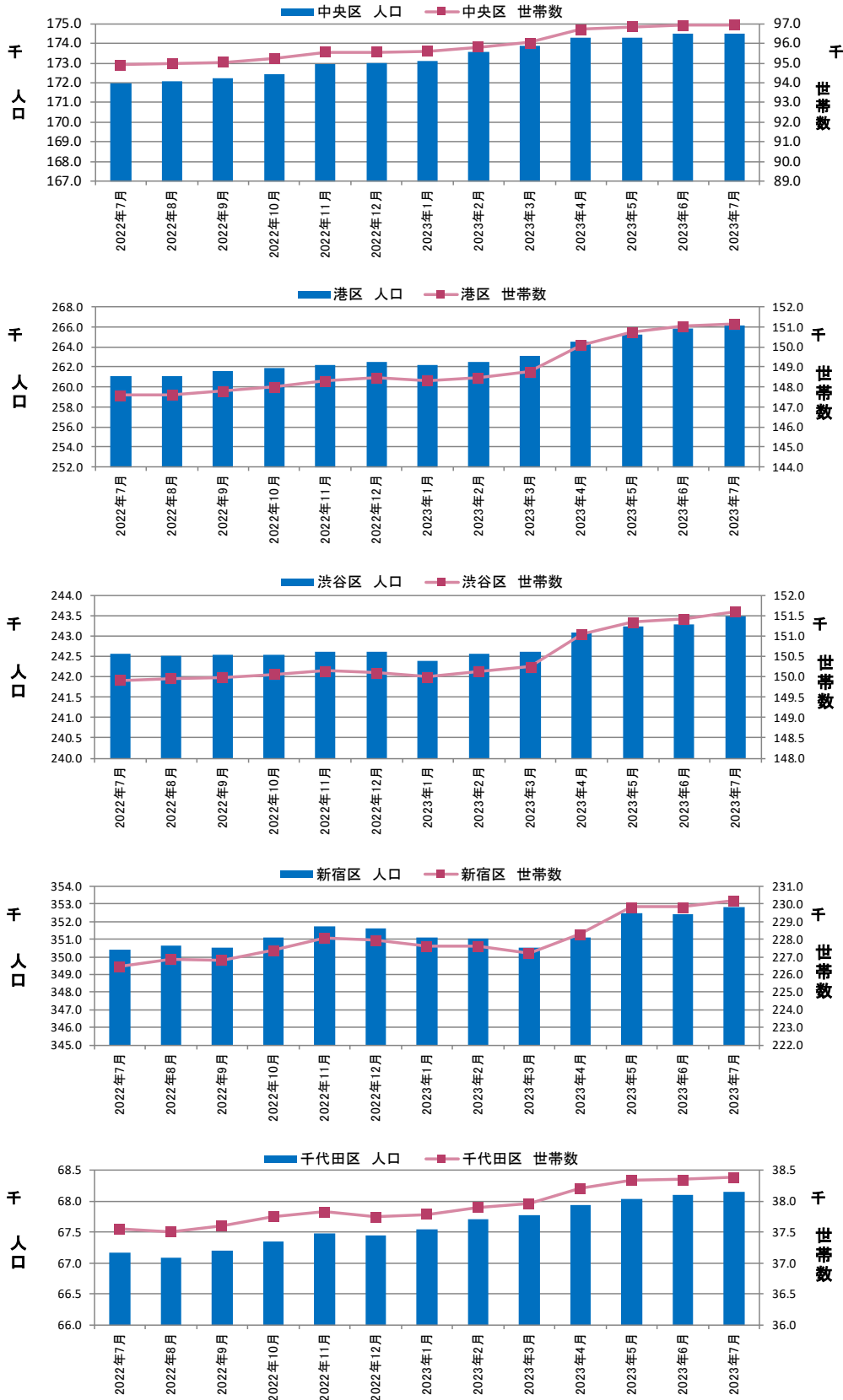
図表③ 都心5区 人口・世帯数推移