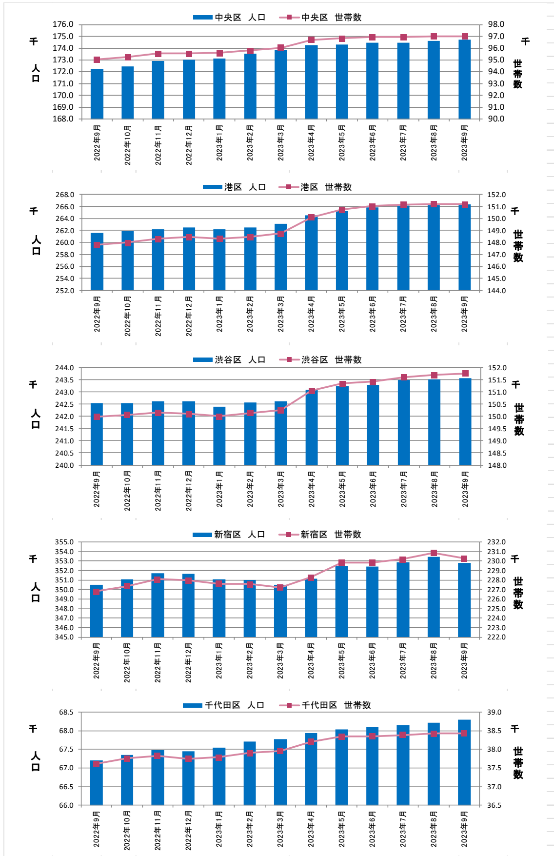
図表③ 都心5区 人口・世帯数推移