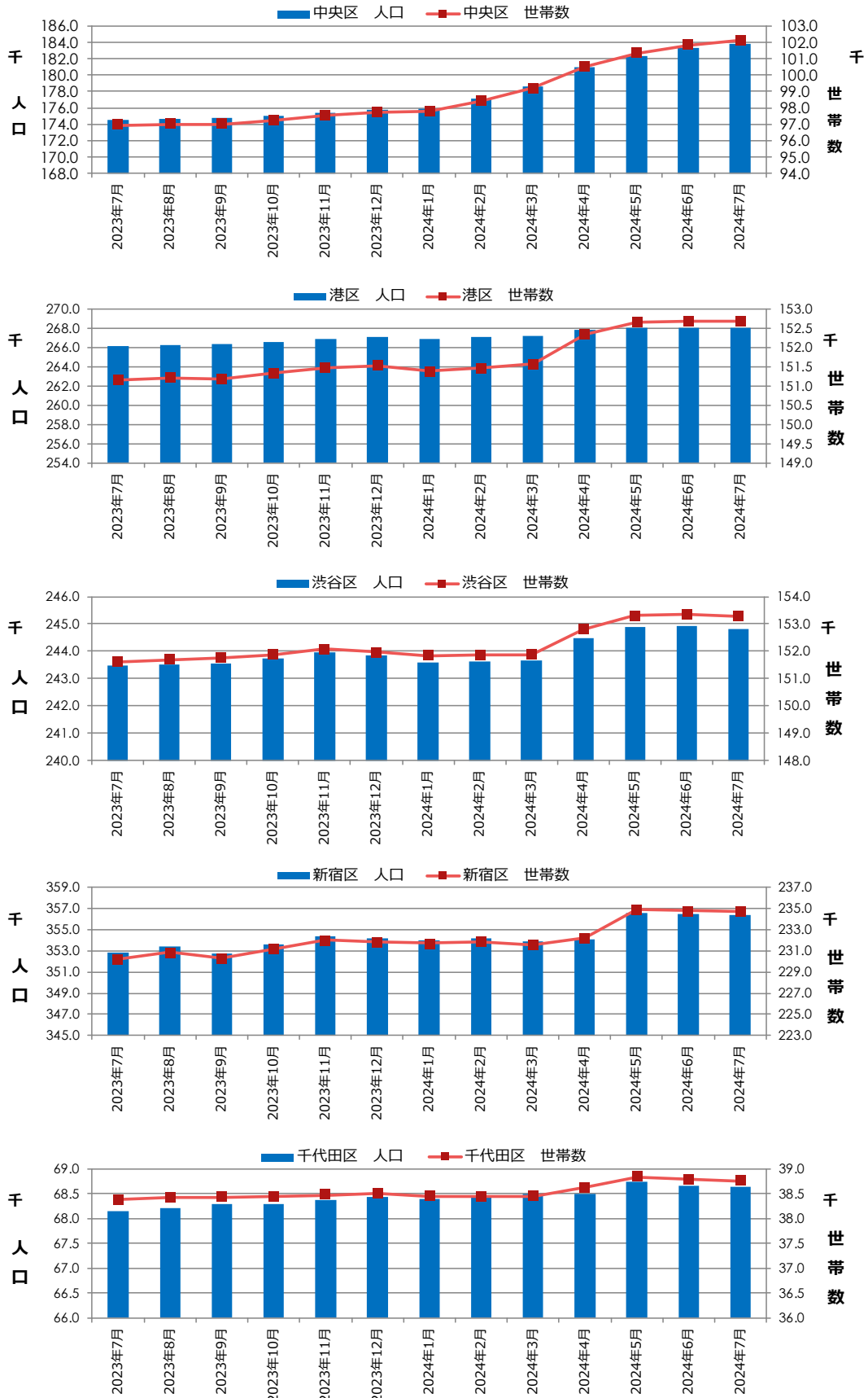
図表③ 都心5区 人口・世帯数推移